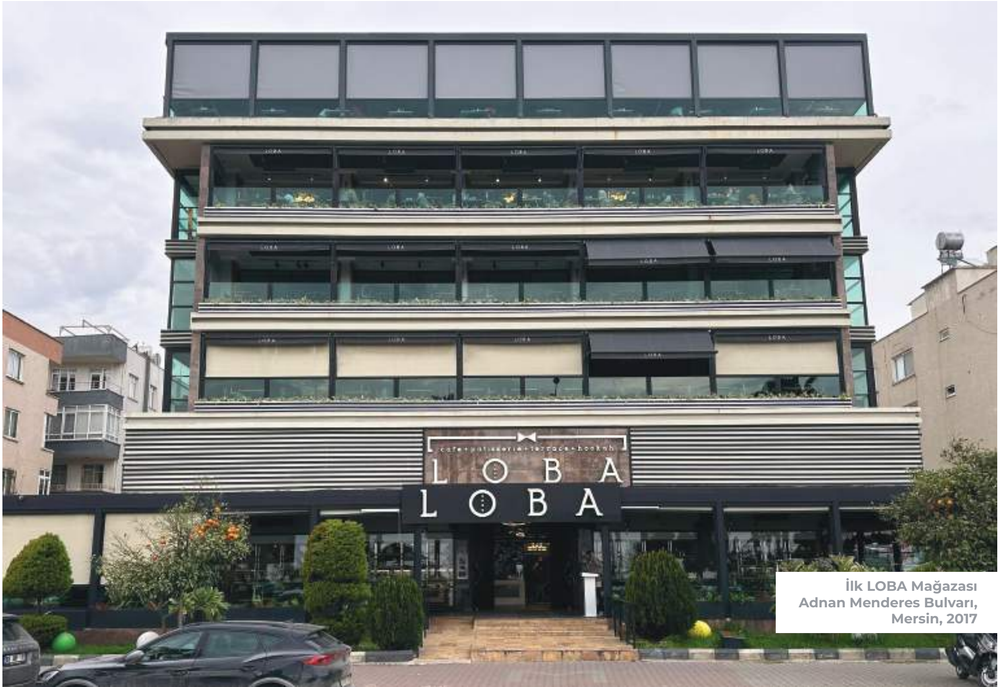
İlk LOBA Mağazası Adnan Menderes Bulvarı, Mersin, 2017