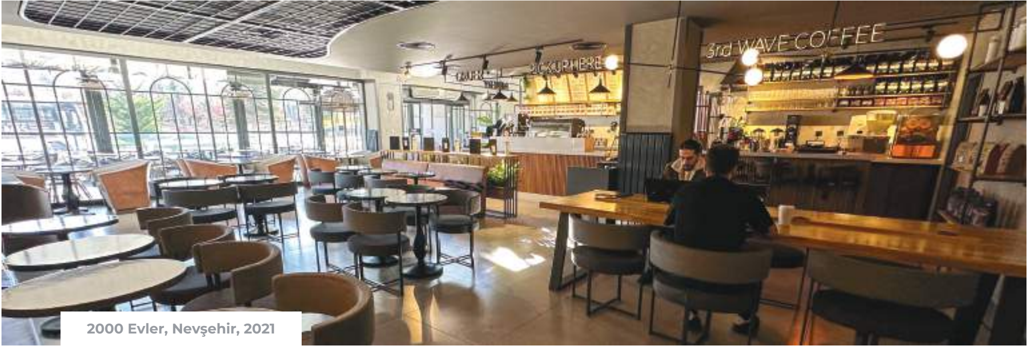
2000 Evler, Nevşehir, 2021