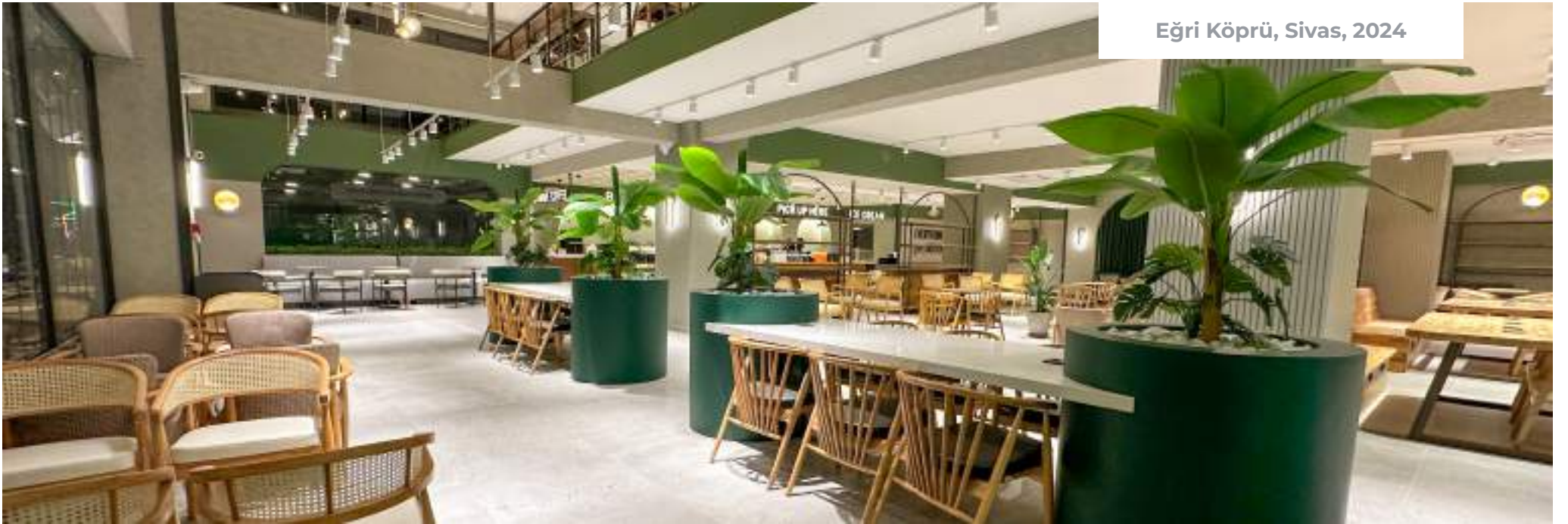
Eğri Köprü, Sivas, 2024