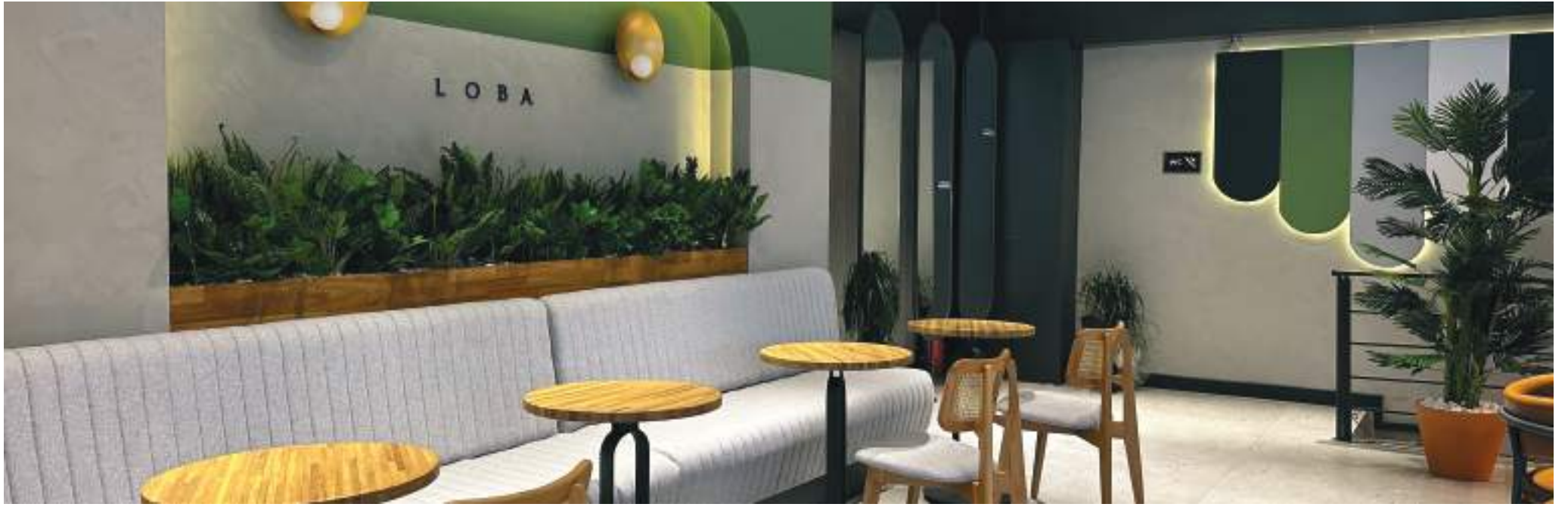
Eti Caddesi, Eskişehir, 2023